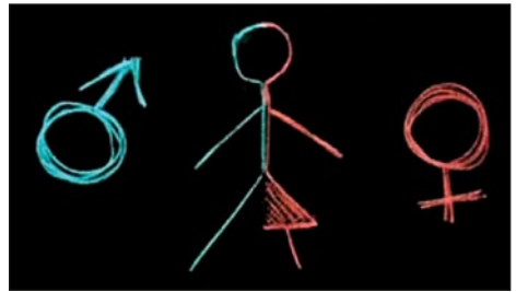
Οὔτε ἀγόρι οὔτε κορίτσι!!!

Ἦδη ὀργανώνονται εἰδικὰ συνέδρια καὶ σεμινάρια μετὰ τὶς «εὐλογίες» τοῦ Ὑπουργείου Παιδείας καὶ μάλιστα σὲ σχολικὸ χῶρο. Πρόσφατο χαρακτηριστικὸ παράδειγμα εἶναι ἡ διοργάνωση διήμερου συνεδρίου (10-11 Μαρτίου 2017) στὸ 66ο Δημοτικὸ Σχολεῖο Ἀθηνῶν (ἐκτός ὥρων λειτουργίας τοῦ σχολείου), ἀπὸ τὴ «Μὴ Κυβερνητικὴ Ὀργάνωση» (ΜΚΟ) «Πολύχρωμο Σχολεῖο» 7 καὶ τὸ Σύλλογο Διδασκόντων τοῦ Δημοτικοῦ Σχολείου, μετὰ θέμα: «Καλὲς Πρακτικὲς γιὰ τὴ