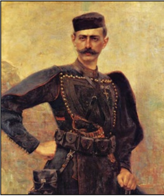
Ο πρωτεργάτης του Μακεδονικού Αγώνα Παύλος Μελάς (1870-1904).

Οι πολυαίματοι αγώνες του Έλληνισμού στον ιερό Αγώνα για την εθνική ανεξαρτησία, τό 1821, έφεραν κάποια εύλογημένη ώρα γλυκείς καρπούς, την ελευθερία και απελευθέρωση από τον ζυγό της δουλείας τετρακοσίων χρόνων. Ανέπνευσαν οι ταλαίπωροι Έλληνες. Όμως, δυστυχώς, όχι όλοι. Τό ελεύθερο Έλληνικό Κράτος, ασφυκτιούσε μέσα στα περιορισμένα όρια πού, τό 1830, του έθεσαν: μιά νοητή γραμμή από τον Παγασητικό μέχρι τον Άμβρακικό κόλπο. Κι αν δέν αγωνισθήκαν, κι αν δέν θυσιάστηκαν στον κοινό αγώνα και οι Έλληνες πάνω από την άσπλαγχνη αυτή γραμμή, οι Μακεδόνες! Κόπηκε στή μέση ό Έλληνισμός.